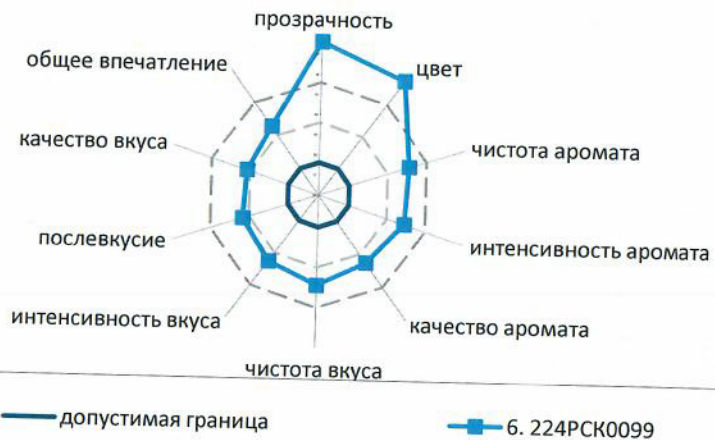
Рис.2.2. Сравнение качества образцов вина тихого (дегустация 09.09.2021 сет 2)

Протокол не может быть воспроизведен полностью или частично без письменного разрешения Руководителя Сенсорной лаборатории. Полученные результаты относятся к предоставленным Заказчиком образцам. Конец выписки из протокола