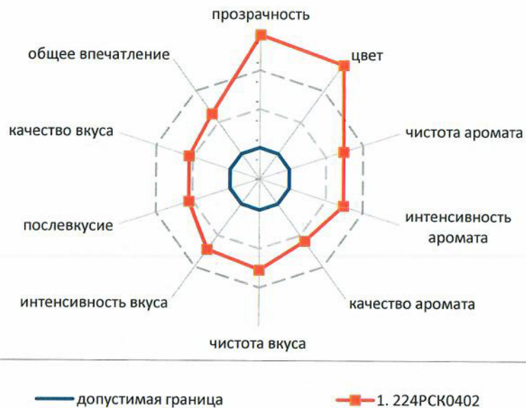
Рис.4.1. Сравнение качества образцов вина тихого (дегустация 20.09.2021 сет 4)

Протокол не может быть воспроизведен полностью или частично без письменного разрешения Руководителя Сенсорной лаборатории. Полученные результаты относятся к предоставленным Заказчиком образцам. Конец выписки из протокола.