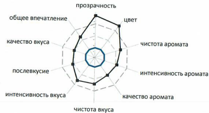
Рис.2.3. Сравнение качества образцов вина тихого (дегустиация 23.09.2021 сет 2)