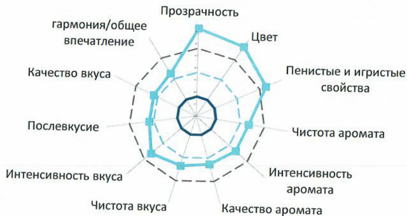
Рис. 2.2. Сравнение качества образцов вина игристого (дегустация 07.09.20201сет 2)