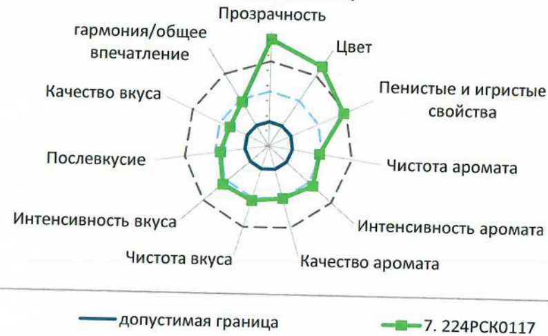
Рис. 1.2. Сравнение качества образцов вина игристого (дегустация 09.09.2021 сет 1)

Протокол не может быть воспроизведен полностью или частично без письменного разрешения Руководителя Сенсорной лаборатории. Полученные результаты относятся к предоставленным Заказчиком образцам. Конец выписки из протокола