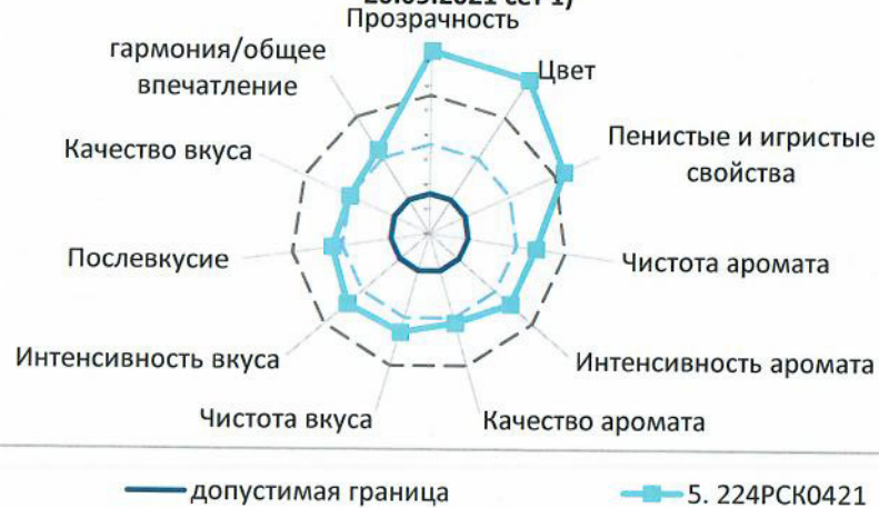
Рис. 1.2. Сравнение качества образцов вина игристого (дегустация 20.09.2021 сет 1)

Протокол не может быть воспроизведен полностью или частично без письменного разрешения Руководителя Сенсорной лаборатории. Полученные результаты относятся к предоставленным Заказчиком образцам. Конец выписки из протокола.