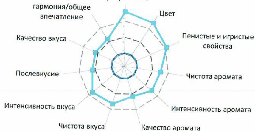
Рис.1.1. Сравнение качества образцов вина игристого (дегустация 15.09.2021 сет 1) Прозрачность