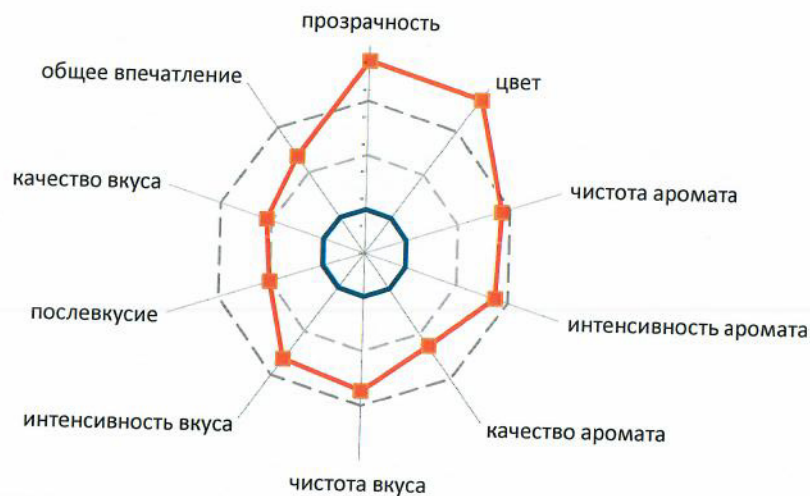
Рис.2.1. Сравнение качества образцов вина тихого (дегустация 14.09.2021 сет 2)