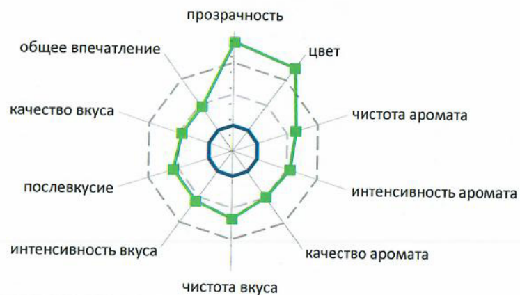
Рис.4.1. Сравнение качества образцов вина тихого (дегустиция 16.09.2021 сет 4)