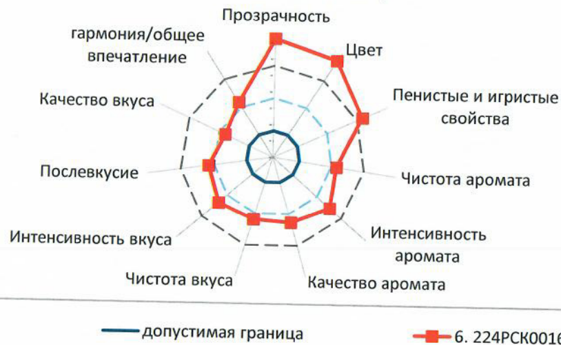
Рис. 2.2. Сравнение качества образцов вина игристого (дегустация 07.09.20201сет 2)

Протокол не может быть воспроизведен полностью или частично без письменного разрешения Руководителя Сенсорной лаборатории. Полученные результаты относятся к предоставленным Заказчиком образцам.