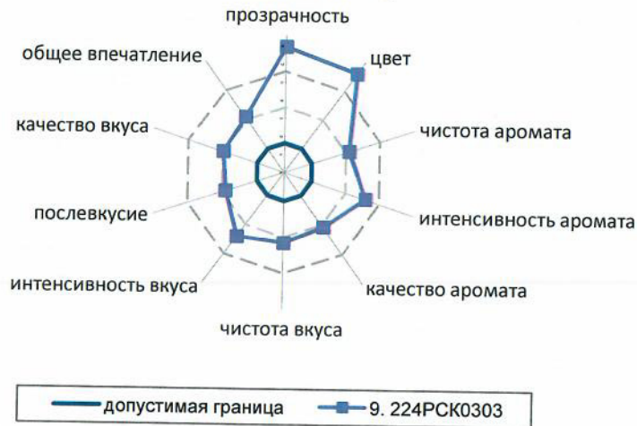
Рис.3.3. Сравнение качества образцов вина тихого (дегустиация 16.09.2021 сет 3)

Протокол не может быть воспроизведен полностью или частично без письменного разрешения Руководителя Сенсорной лаборатории. Полученные результаты относятся к предоставленным Заказчиком образцам. Конец выписки из протокола.