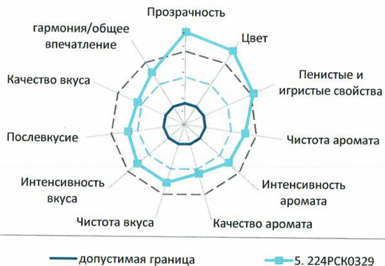
Рис. 1.2. Сравнение качества образцов вина игристого (дегустиация 16.09.2021 сет 1)

Протокол не может быть воспроизведен полностью или частично без письменного разрешения Руководителя Сенсорной лаборатории.