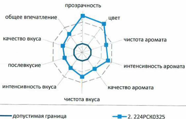
Рис.2.1. Сравнение качества образцов вина тихого (дегустация 16.09.2021 сет 2)

Протокол не может быть воспроизведен полностью или частично без письменного разрешения Руководителя Сенсорной лаборатории.