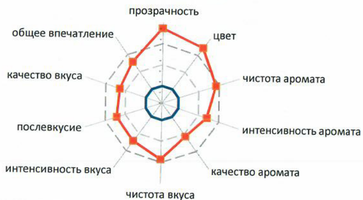
Рис.2.1. Сравнение качества образцов вина тихого (дегустиция 27.09.2021 сет 2)