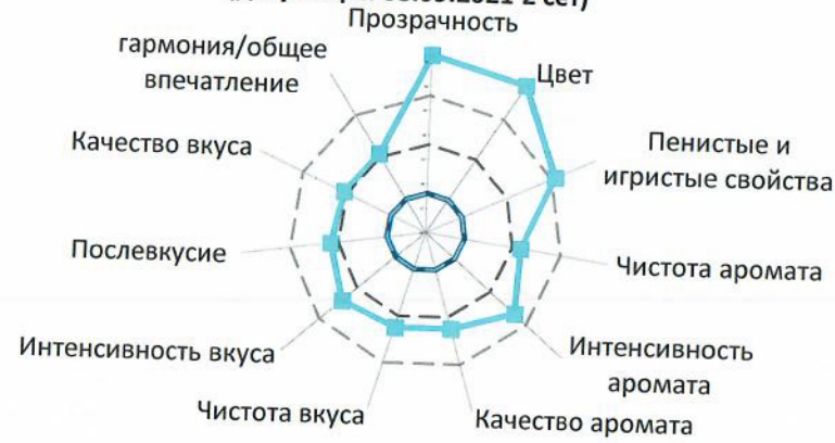
Рис.2.1. Сравнение качества образцов вина игристого (дегустация 08.09.2021 2 сет)