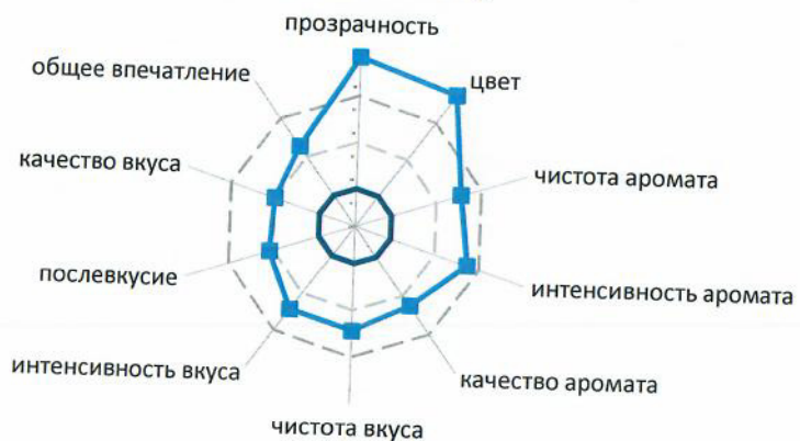
Рис.2.2. Сравнение качества образцов вина тихого (дегустация 17.09.2021 сет 2)