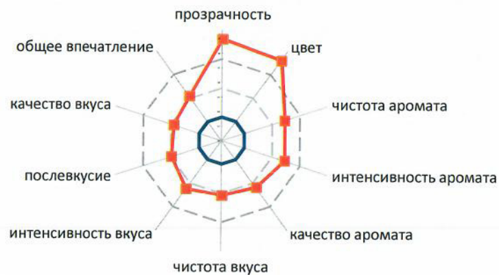
Рис.4.1. Сравнение качества образцов вина тихого (дегустация 23.09.2021 сет 4)