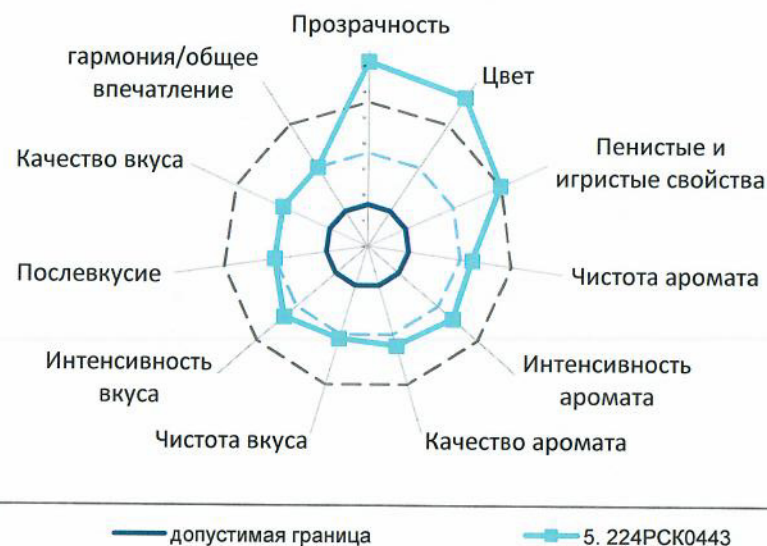
Рис. 1.2. Сравнение качества образцов вина игристого (дегустиция 21.09.2021 сет 1)

Протокол не может быть воспроизведен полностью или частично без письменного разрешения Руководителя Сенсорной лаборатории.