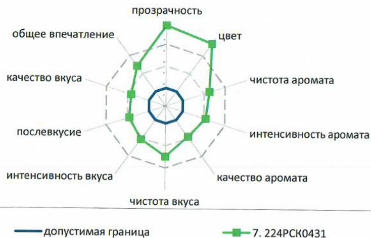
Рис.2.2. Сравнение качества образцов вина тихого (дегустация 21.09.2021 сет 2)

Протокол не может быть воспроизведен полностью или частично без письменного разрешения Руководителя Сенсорной лаборатории. Полученные результаты относятся к предоставленным Заказчиком образцам.