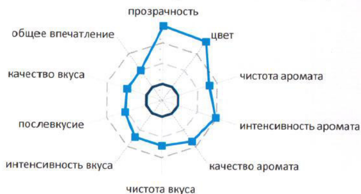
Рис.2.1. Сравнение качества образцов вина тихого (дегустация 15.09.2020 сет 2)