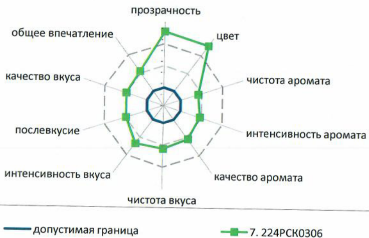
Рис.4.2. Сравнение качества образцов вина тихого (дегустация 16.09.2021 сет 4)

Протокол не может быть воспроизведен полностью или частично без письменного разрешения Руководителя Сенсорной лаборатории. Полученные результаты относятся к предоставленным Заказчиком образцам. Конец выписки из протокола.