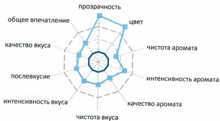
Рис.2.3. Сравнение качества образцов вина тихого (дегустация 17.09.2021 сет 2)