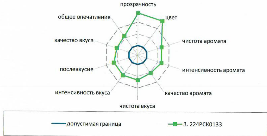
Рис.3.1. Сравнение качества образцов вина тихого (дегустация 10.09.2021 сет 3)

Протокол не может быть воспроизведен полностью или частично без письменного разрешения Руководителя Сенсорной лаборатории. Полученные результаты относятся к предоставленным Заказчиком образцам. Конец выписки из протокола.