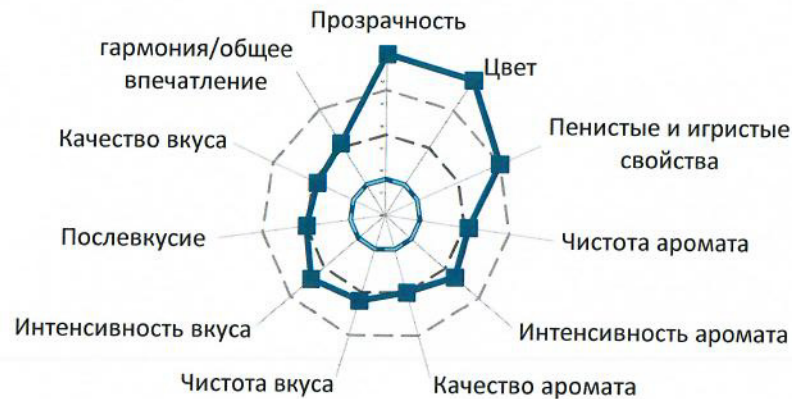
Рис.1.1. Сравнение качества образцов вина игристого (дегустиация 13.09.2021 1 сет)