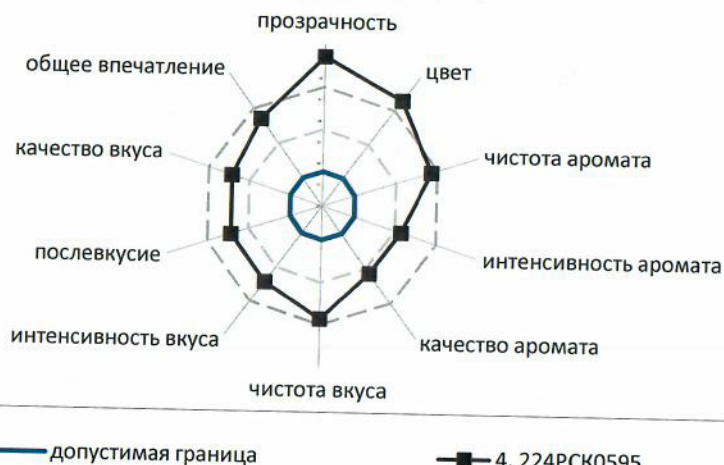
Рис.2.1. Сравнение качества образцов вина тихого (дегустация 27.09.2021 сет 2)

Протокол не может быть воспроизведен полностью или частично без письменного разрешения Руководителя Сенсорной лаборатории. Полученные результаты относятся к предоставленным Заказчиком образцам. Конец выписки из протокола.