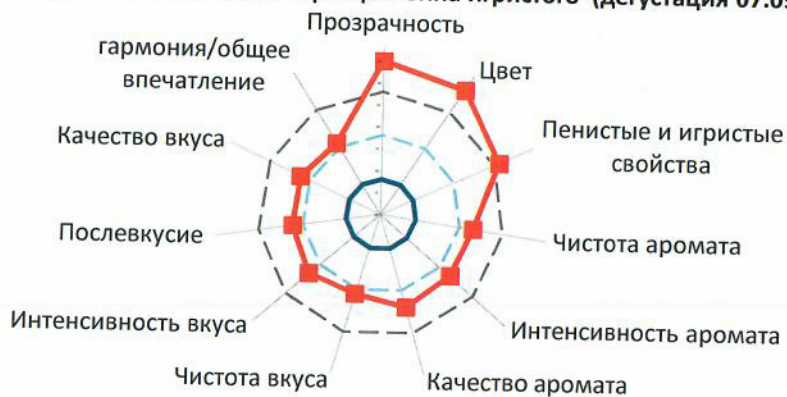
Рис. 1.3. Сравнение качества образцов вина игристого (дегустиция 07.09.2021 сет 1)