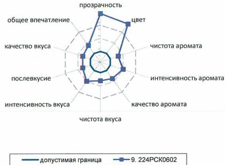
Рис.4.3. Сравнение качества образцов вина тихого (дегустиция 20.09.2021 сет 4)

Протокол не может быть воспроизведен полностью или частично без письменного разрешения Руководителя Сенсорной лаборатории. Полученные результаты относятся к предоставленным Заказчиком образцам. Конец выписки из протокола.