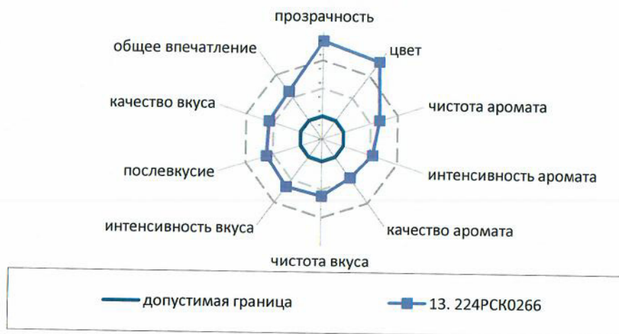
Рис.4.4. Сравнение качества образцов вина тихого (дегустиация 15.09.2021 сет 4)

Протокол не может быть воспроизведен полностью или частично без письменного разрешения Руководителя Сенсорной лаборатории. Полученные результаты относятся к предоставленным Заказчиком образцам. Конец выписки из протокола.