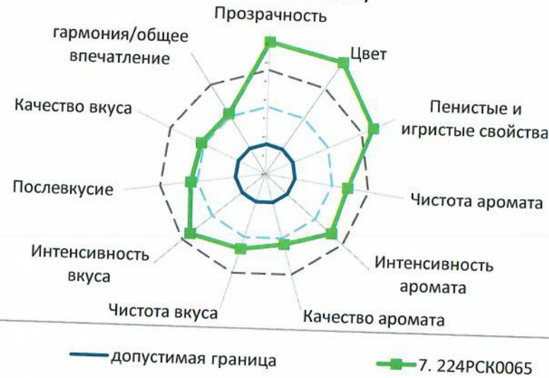
Рис. 2.2. Сравнение качества образцов вина игристого (дегустация 08.09.2021сет 2)

Протокол не может быть воспроизведен полностью или частично без письменного разрешения Руководителя Сенсорной лаборатории. Полученные результаты относятся к предоставленным Заказчиком образцам. Конец выписки из протокола.