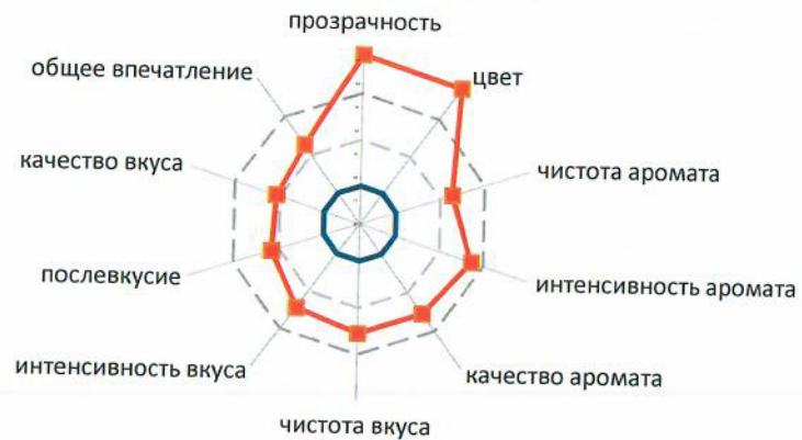
Рис.4.1. Сравнение качества образцов вина тихого (дегустация 07.09.2021 сет 4)