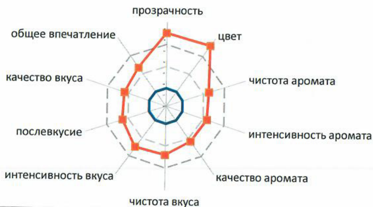
Рис.4.2. Сравнение качества образцов вина тихого (дегустация 15.09.2021 сет 4)