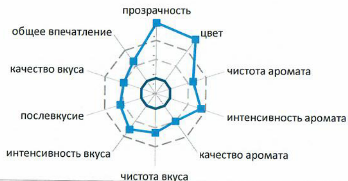
Рис.4.2. Сравнение качества образцов вина тихого (дегустация 10.09.2021 сет 4)