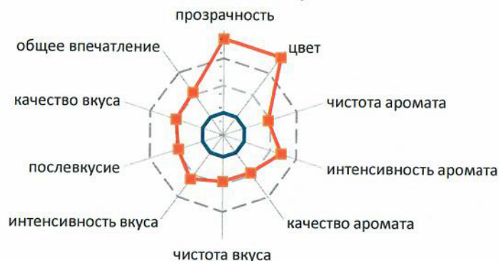
Рис.4.1. Сравнение качества образцов вина тихого (дегустация 10.09.2021 сет 4)