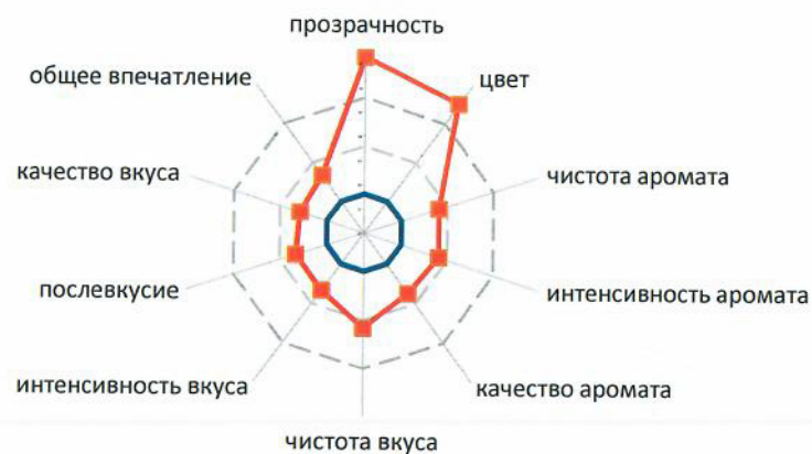
Рис.2.1. Сравнение качества образцов вина тихого (дегустация 21.09.2021 сет 2)