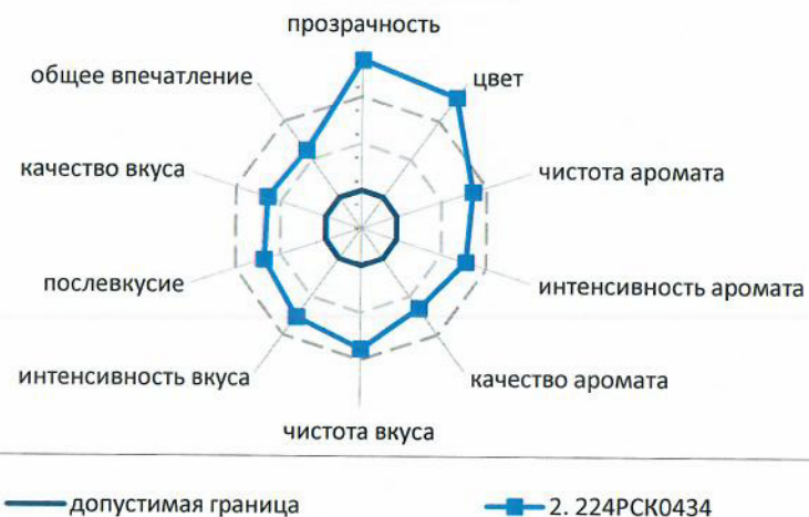
Рис.4.1. Сравнение качества образцов вина тихого (дегустиация 21.09.2021 сет 4)

Протокол не может быть воспроизведен полностью или частично без письменного разрешения Руководителя Сенсорной лаборатории. Полученные результаты относятся к предоставленным Заказчиком образцам. Конец выписки из протокола.