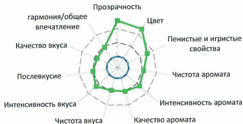
Рис.1.1. Сравнение качества образцов вина игристого (дегустация 16.09.2021 сет 1)