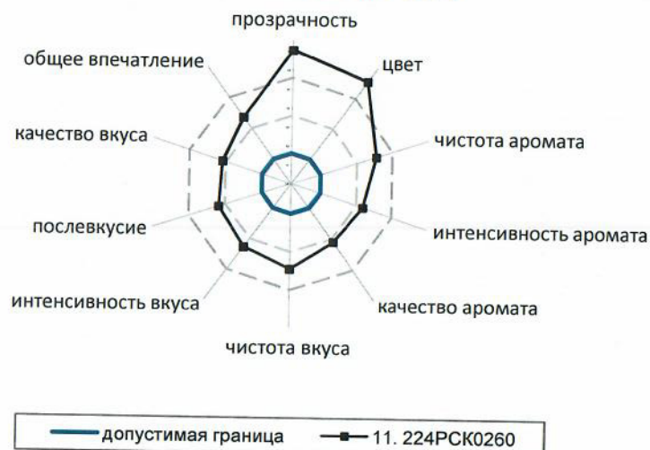
Рис.2.3. Сравнение качества образцов вина тихого (дегустиация 15.09.2021 сет 2)

Протокол не может быть воспроизведен полностью или частично без письменного разрешения Руководителя Сенсорной лаборатории.