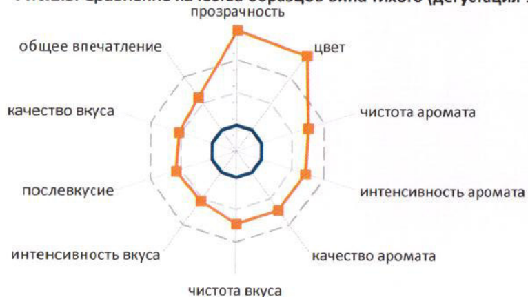
Рис.2.3. Сравнение качества образцов вина тихого (дегустация 15.09.2020 сет 2)