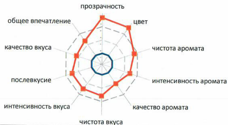
Рис.4.2. Сравнение качества образцов вина тихого (дегустация 23.09.2021 сет 4)