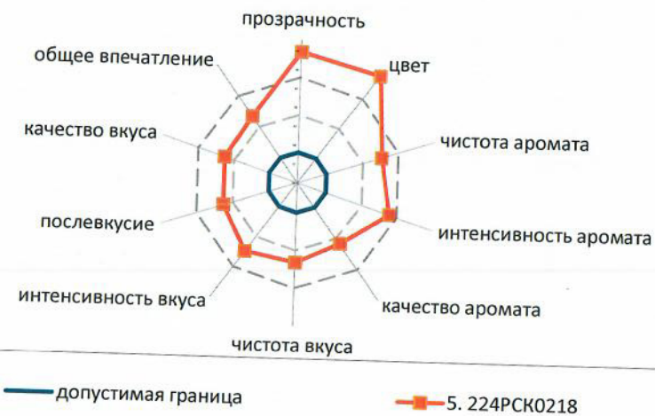
Рис.4.2. Сравнение качества образцов вина тихого (дегустация 14.09.2021 сет 4)

Протокол не может быть воспроизведен полностью или частично без письменного разрешения Руководителя Сенсорной лаборатории. Полученные результаты относятся к предоставленным Заказчиком образцам. Конец выписки из протокола.