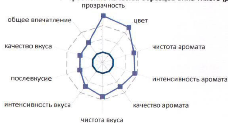
Рис.1.3. Сравнение качества образцов вина тихого (дегустация 16.09.2020 сет 1)