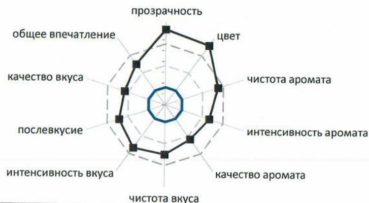
Рис.4.2. Сравнение качества образцов вина тихого (дегустация 23.09.2021 сет 4)