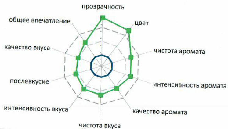
Рис.1.2. Сравнение качества образцов вина тихого (дегустация 27.09.2021 сет 1)