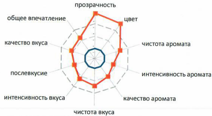
Рис.4.1. Сравнение качества образцов вина тихого (дегустация 21.09.2021 сет 4)