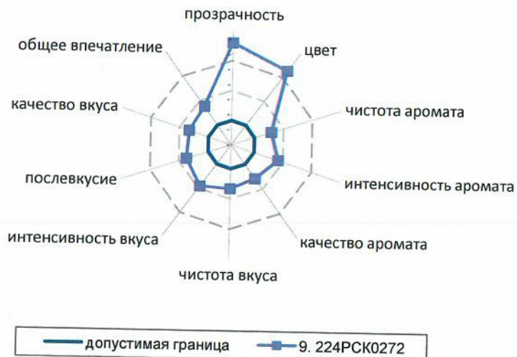
Рис.2.3. Сравнение качества образцов вина тихого (дегустиция 15.09.2021 сет 2)

Протокол не может быть воспроизведен полностью или частично без письменного разрешения Руководителя Сенсорной лаборатории. Полученные результаты относятся к предоставленным Заказчиком образцам. Конец выписки из протокола.