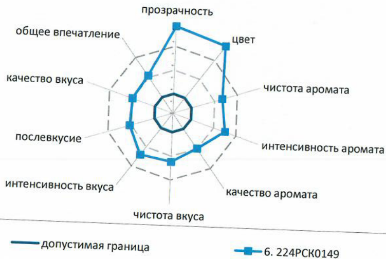
Рис.2.2. Сравнение качества образцов вина тихого (дегустиция 10.09.2021 сет 2)

Протокол не может быть воспроизведен полностью или частично без письменного разрешения Руководителя Сенсорной лаборатории. Полученные результаты относятся к предоставленным Заказчиком образцам. Конец выписки из протокола.