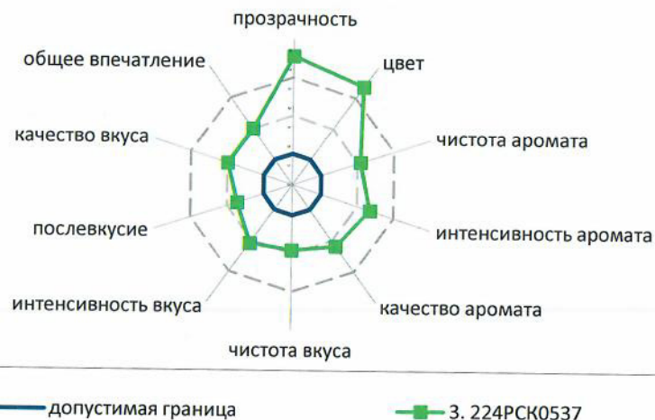
Рис.2.1. Сравнение качества образцов вина тихого (дегустация 23.09.2021 сет 2)

Протокол не может быть воспроизведен полностью или частично без письменного разрешения Руководителя Сенсорной лаборатории.