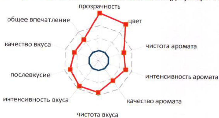
Рис.3.2. Сравнение качества образцов вина тихого (дегустация 18.09.2020 сет 3)