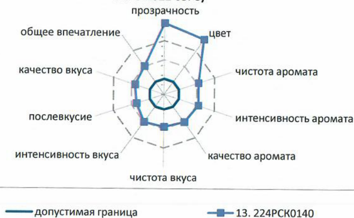
Рис.3.4. Сравнение качества образцов вина тихого (дегустиация 10.09.2021 сет 3)

Протокол не может быть воспроизведен полностью или частично без письменного разрешения Руководителя Сенсорной лаборатории.