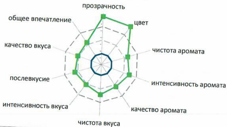
Рис.2.1. Сравнение качества образцов вина тихого (дегустация 10.09.2021 сет 2)